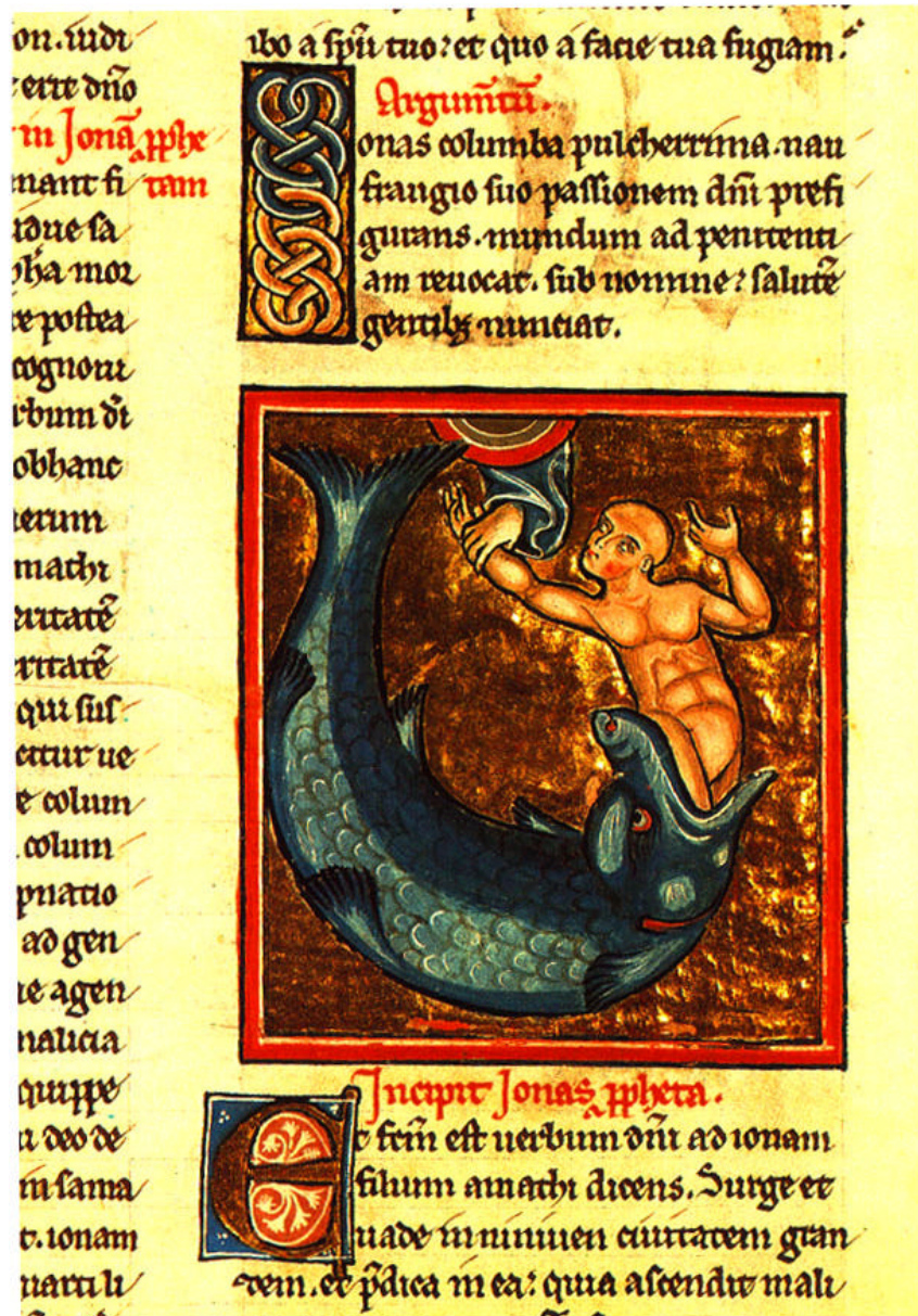
Le sauvetage de Jonas, Heisterbacher Bibel, Cologne (?) vers 1240, Staatsbibliothek Preussischer Kulturbesitz Berlin, Ms. theol. lat. fol. 379, 377.