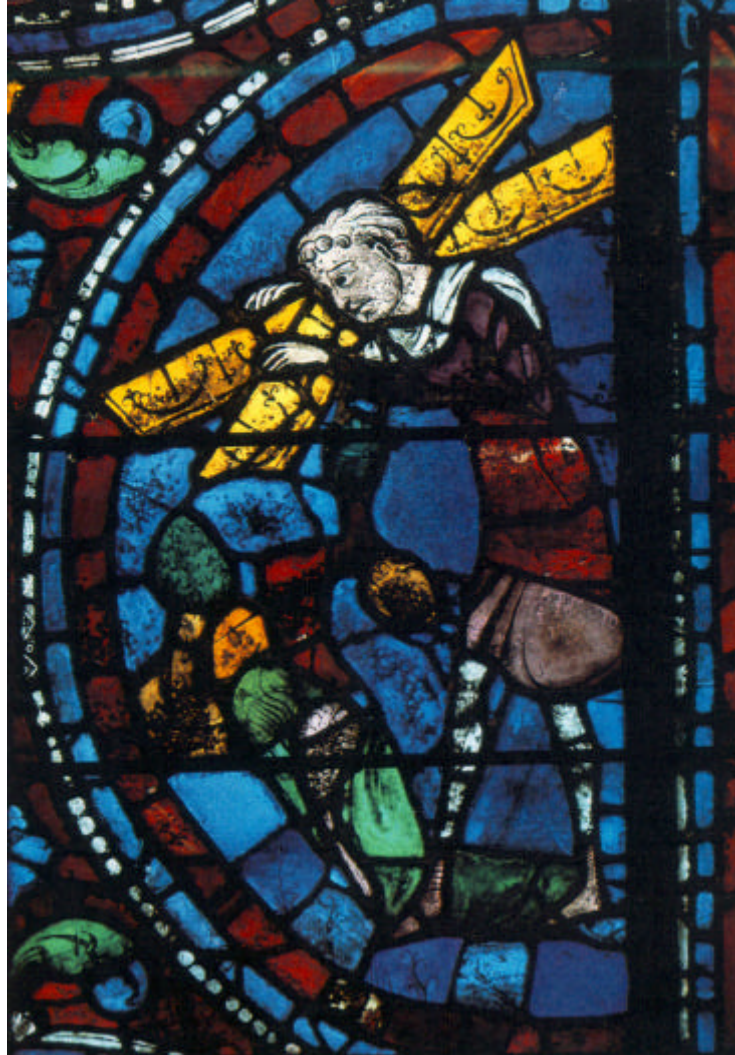
Samson et les portes de Gaza, détail du vitrail dit de la Rédemption (XIII e siècle), cathédrale Notre-Dame, Chartres.