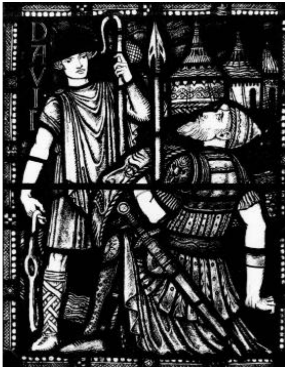
David et Goliath La Bible en vitraux