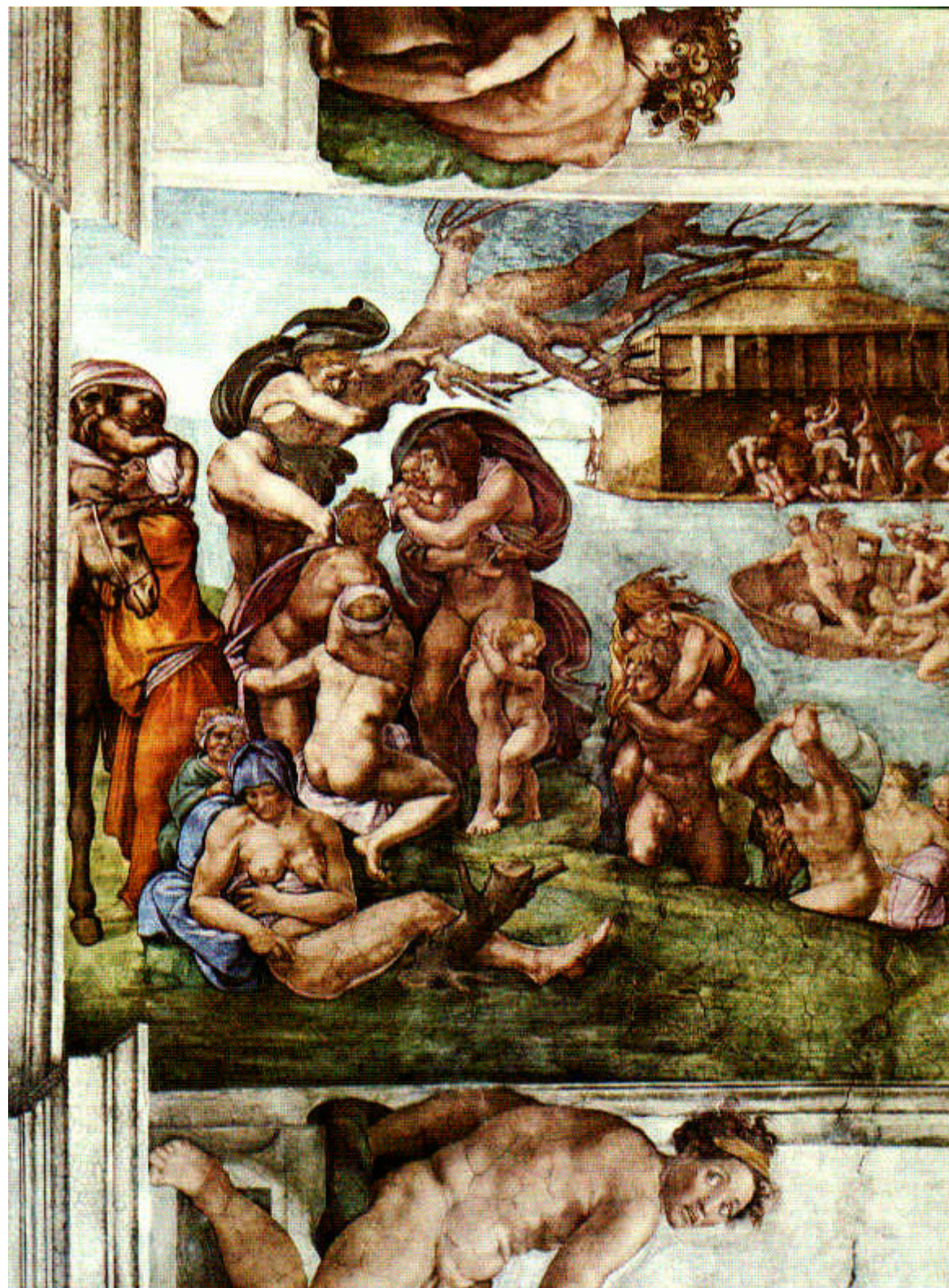
Michelangelo Le Déluge