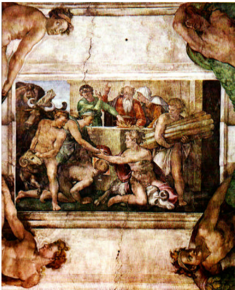
Michel-Ange, Le sacrifice de Noé, Voûte de la Chapelle Sixtine, 1508-1512.

16 L'arc sera dans le nuage, et je le verrai pour me souvenir de l'alliance perpétuelle entre Elohim et tout animal vivant en toute chair qui est sur la terre. » 17 Elohim dit à Noé : « Ceci est le signe de l'alliance que j'ai établie entre moi et toute chair qui est sur la terre. »